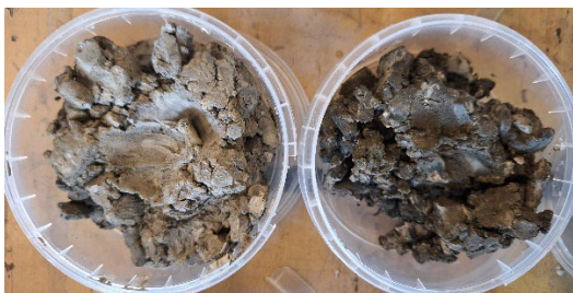
80-84 m overgang Gelinden-Orp