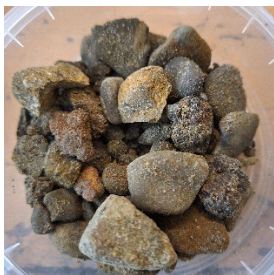
8-10 m psammiet grind