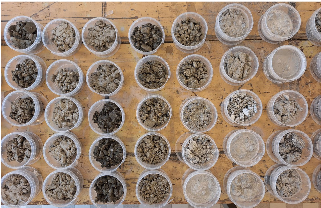
58-60m linksboven 66-68m linksonder 118-120 m rechtsboven 126-128 m rechtsonder