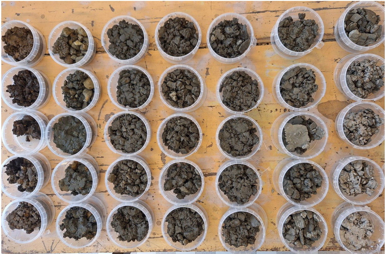
0-2 m linksboven 7-8 m linksonder 58-60 m rechtsboven 66-68 m rechtsonder