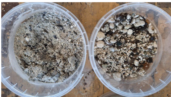
182-184 m overgang boven-onder Gulpen